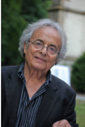
Schriftsteller Adonis